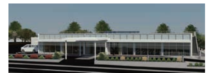
▲麻里府公民館整備後イメージ図