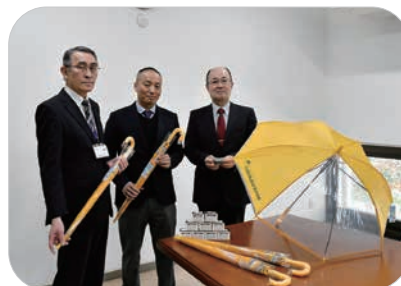
▲一般社団法人山口県トラック協会より

※3月8日(金) 田布施中学校卒業式、3月19日(火) 町内各小学校の卒業式が行われ、卒業生全員がこのコサージュを胸につけ、立派に巣立っていきました。