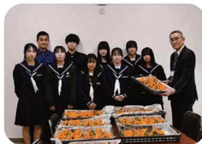
▲田布施農工高校生物生産科より