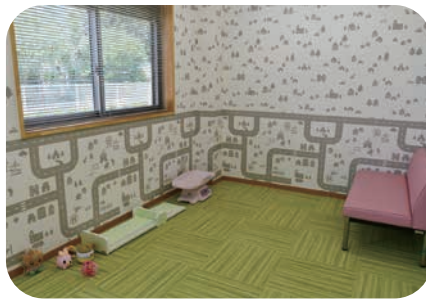
▲相談室 (1 ~ 3)