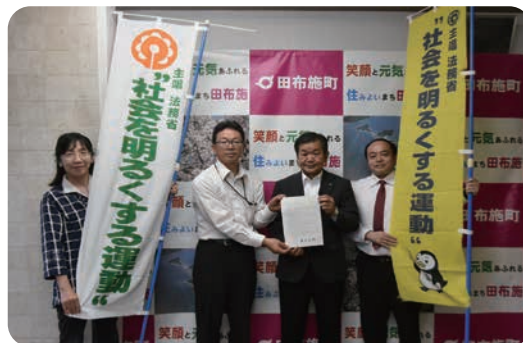
▲総理大臣メッセージ伝達式（町長室）

この運動は、すべての国民が、犯罪や非行の防止と犯罪や非行をした人たちの更生について理解を深め、それぞれの立場において力を合わせ、犯罪や非行のない安全で安心な地域社会を築くための全国的な運動で、令和5年で73回目を迎えます。