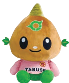
たぶせPRキャラクター 『たぶちゃん』

災害や収入の減少などの特別な事情により、医療機関での一部負担金(自己負担額)の支払いが困難な人で、申請により必要と認められた場合は、一部負担金の減額や徴収猶予の措置を受けることができます。詳細は、健康保険課保険年金係にお問い合わせください。