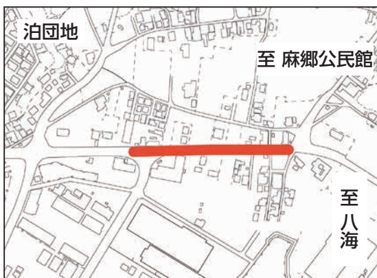
▲米出地区自転車歩行者道整備箇所

国土交通省に要望していた、米出地区自転車歩行者道整備と戎ヶ下地区歩道整備について、令和5年度から事業実施となりました。事業推進に向けてご協力いただきますようお願いします。