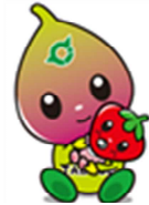
たぶせPRキャラクター 「たぶちゃん・らぶちゃん」