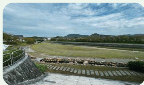
▲地域交流館裏の中州にステージを設置