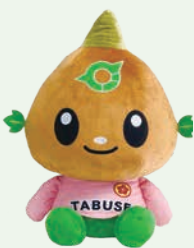
たぶせ PR キャラクター 『たぶちゃん』