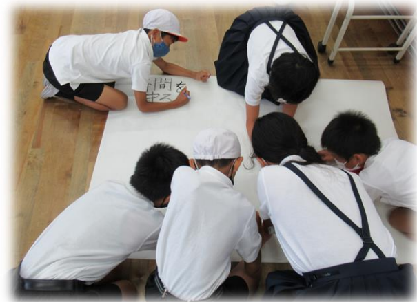
玄関入口掲示板の準備