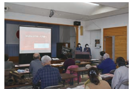
シニア向けスマホ教室