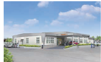
保健センター新築工事