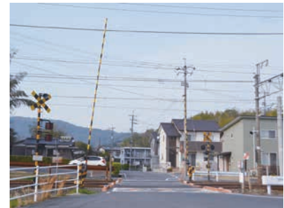
豆尾第1踏切拡幅事業