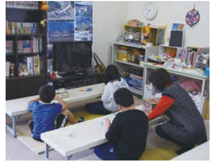
麻郷児童クラブ2組移転整備