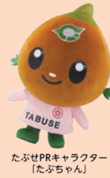
たぶせPRキャラクター 「たぶちゃん」

国民健康保険に加入している40歳～74歳の人を対象に、生活習慣病の早期発見や予防を目的とした『特定健診』を実施しています。