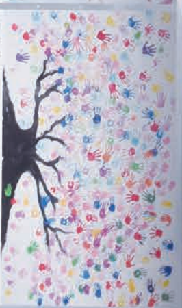
特刊「田布施駅55周年記念事業」