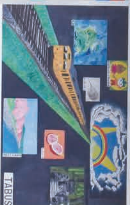
特刊「田布施駅55周年記念事業」