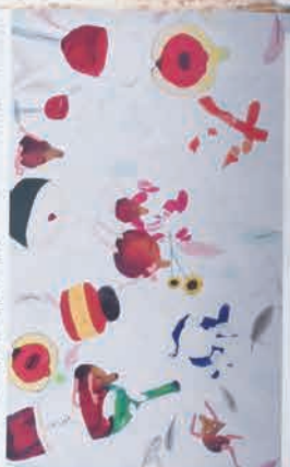
特刊「田布施駅55周年記念事業」