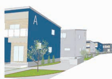
城南住宅建替事業 (イメージ)