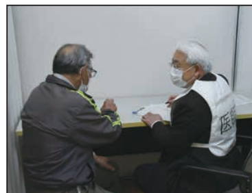
新型コロナウイルスワクチン接種対策