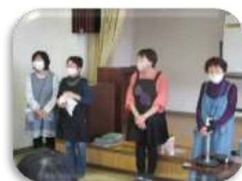
フランス刺繍の方々にお手 伝いさせていただきました