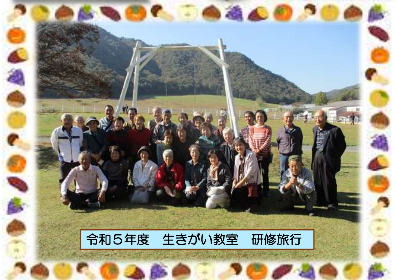
令和5年度 生きがい教室 研修旅行