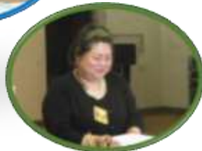
講師 トイ・トイ・トイの皆さん

久しぶりの歌の教室です。歌を聞いたり歌ったり、顔の筋肉がほぐれるお口の体操もみんなで楽しくやりました。心も顔も笑顔になりました。