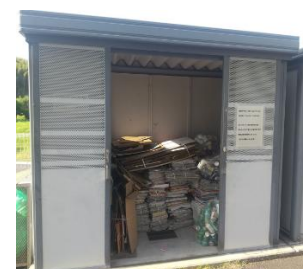
左側に分別して収納して下さい