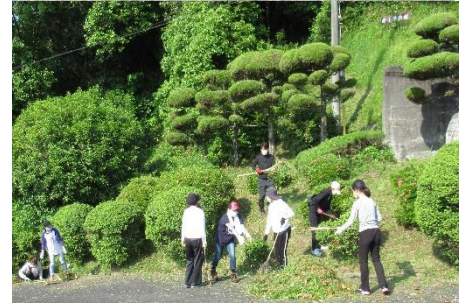
P T A 草刈り作業