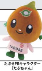
たぶせPRキャラクター「たぶちゃん」