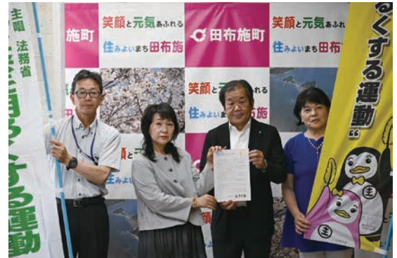
▲総理大臣メッセージ伝達式（町長室）