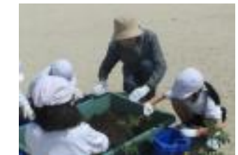
子どもたちは丁寧に鉢に土とトマトの苗を入れました