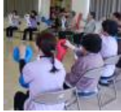
座ったまま、道具を使って楽しく