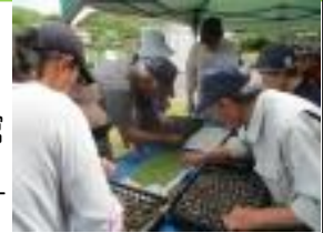
昨年の作業の様子

内容 3種類の花(マリ ゴールド・千日紅・ 松葉牡丹)の小さな 苗を、ポットに植え替える。