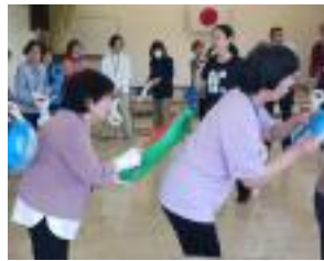
立ち上がって、動きを付けてより楽しく