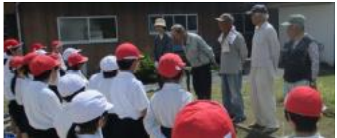
児童と地域の方とのあいさつから始まりました

収穫できるまで手入れをしっかりと、命や食の大切さなど、多くのことを学んでほしいと思います。