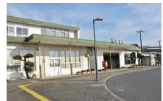
▲ JR 田布施駅