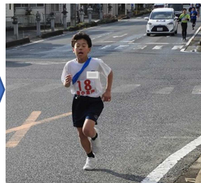
【必死のたすきリレー】