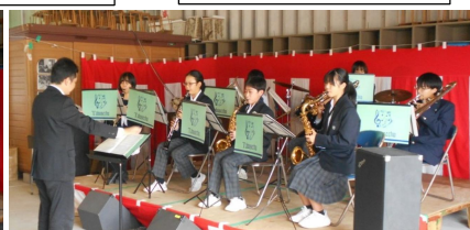
田布施中学校 吹奏楽部