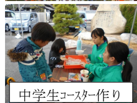
中学生コースター作り