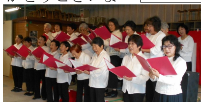
コール・さくらと浄泉寺混合合唱