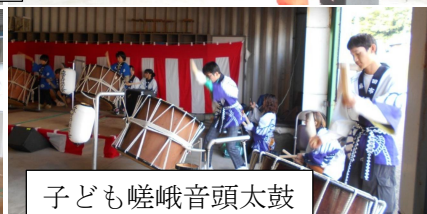
子ども嵯峨音頭太鼓