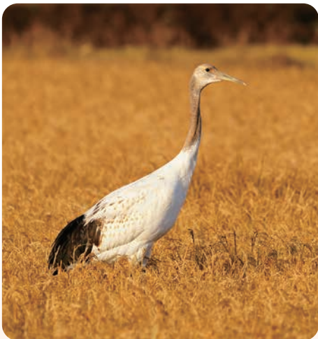
▲令和7年12月に飛来した鶴

結びに、本年が、明るく希望に満ちた素晴らしい1年となりますよう心からお祈り申し上げます。げ、年頭の挨拶といたします。