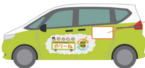
▲車体広告イメージ