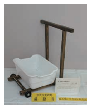
▲今井裕貴さんの作品 『かんたん草とりき』