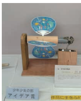
▲中谷直大朗さんの作品 『三つのうちわ』