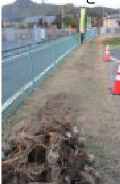
おかげでフェンス沿いでしたが

12月10日(水)と11日(木)の二日、町の作業員さん二名で公民館敷地内に残っている切り株を処分してもらいました。11日午後から雨が降り、切り株すべてを撤去することができませんでした。おかげでフェンス沿いでしたが、八割方取り除くことができました。ありがとうございました。