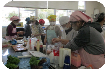
先生からたくさん教わりました