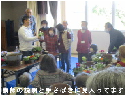
講師の説明と手さばきに見入ってます