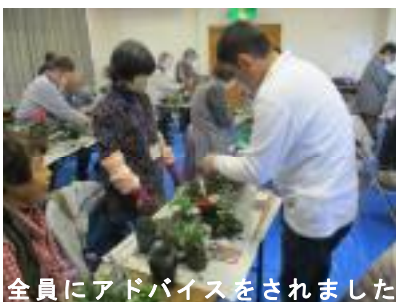
全員にアドバイスをされました