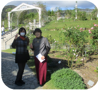
植物園の広大な敷地の随所には美しい花や木がたくさん