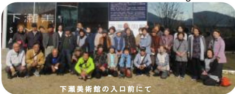
下瀬美術館の入口前にて