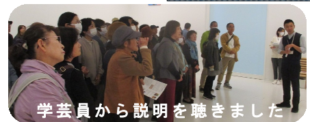
学芸員から説明を聴きました