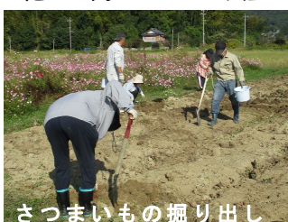
さつまいもの掘り出し

花壇では枯れた花を撤去し、芋畑ではまつりで掘り残した芋を掘り、トラクターで整地をしました。掘った芋の一部は公民館まつりに使いました。コスモスは、まだ花が咲いており、種の収穫量は例年より少なかったようです。