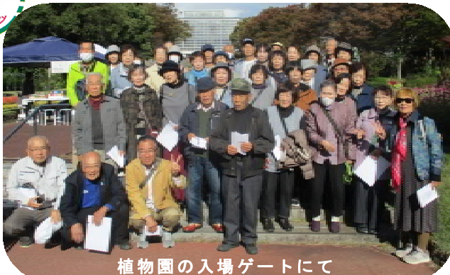
植物園の入場ゲートにて