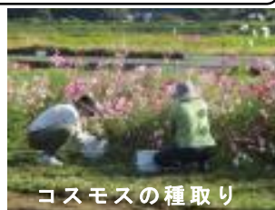
コスモスの種取り

10月26日(日)、コスモスの種取りと花壇・芋畑の整備をしました。34名の参加がありました。