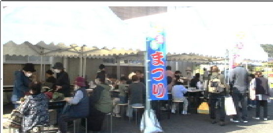
婦人会の「うどん(左)」と大波野有志の「焼鳥足」は毎回大人気です。