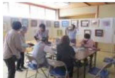
1 階和室では「ちぎり絵教室」のワークショップが開かれました。