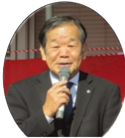
東町長が祝辞を述べられました

11月16日(日)、爽やかな秋空の下で、第38回公民館まつりを開催しました。天候に恵まれたこともあり、駐車場の少ない中でも四百名を超える人たちに訪れていただきました。おかげで、一日大いに賑わった催しとなりました。ありがとうございました。また、出演や展示にご協力いただいた皆様、準備や運営をしていただいた役員・ボランティアの皆様、大変お世話になりました。当日の一部を写真でお伝えします。