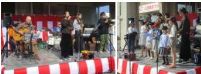
スタジオUによるバンド演奏、2回めのステージでは、子ども達がトトロを歌って盛り上げてくれました。