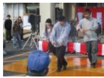
フレイクダンスの皆さんの日頃の鍛錬に感心しました