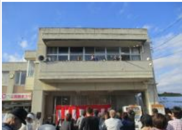
フィナーレは定番の「餅まき」。今年は「合併 70 周年記念」として、当たりくじ付きの餅まきでした。全部で 22 名の方に当たりました。