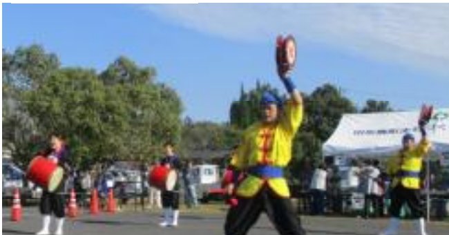
オープニングショーを務めていただいた琉球國祭り太鼓山口支部の皆さんが、キビキビとした演技で、観衆を魅了しました。

11月16日(日)、爽やかな秋空の下で、第38回公民館まつりを開催しました。天候に恵まれたこともあり、駐車場の少ない中でも四百名を超える人たちに訪れていただきました。おかげで、一日大いに賑わった催しとなりました。ありがとうございました。また、出演や展示にご協力いただいた皆様、準備や運営をしていただいた役員・ボランティアの皆様、大変お世話になりました。当日の一部を写真でお伝えします。