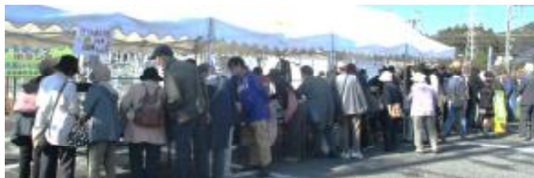
毎年、掘り出し物目指して「遊休品」バザーには多くの人が集まります