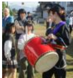
琉球國祭り太鼓の皆さんとふれあうことができ、楽しいオープニングショーでした。