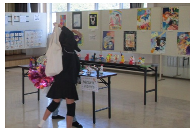
大会議室では、東小、田布施中、生きがい教室の皆さんの作品展示をしました。