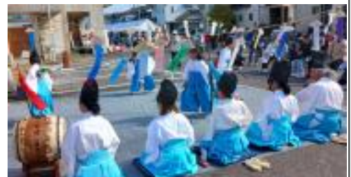
大波野神舞では、子ども達が中心の演舞を披露してくれました。