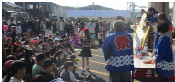
大抽選会には、今年も多くの人が集まりました。1 位の商品は、米 10kg と肉のセットでした。