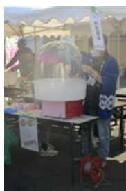
綿菓子作りに格闘中