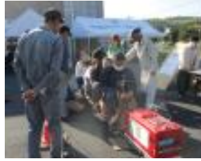
庭園鉄道は子どもだけでなく大人にも大人気です。