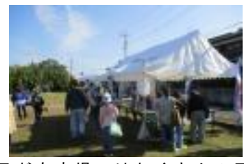
子ども広場ではたくさんの子ども達が元気いっぱいに活動してくれました。