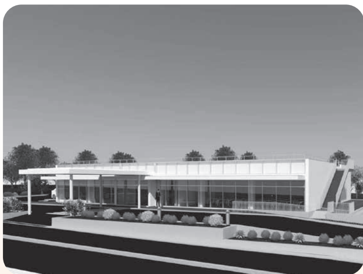
▲建設予定の麻里府公民館の外観（イメージ）

また、ハード事業では、麻里府公民館の移転整備事業、大平飲料水供給施設更新事業、平生町の学校給食事務受託による給食センター整備事業に取り組むこととしています。結びに、新しい年が皆様にとりまして、素晴らしい年になりますよう、祈念いたします。新年のごあいさつといたします。