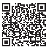
▲国税庁ホームページ

国税の納付は、金融機関や税務署などの窓口に行く必要がない、非対面の『キャッシュレス納付（ダイレクト納付、振替納税、インターネットバンキングなど、クレジットカード納付、スマホアプリ納付）』が大変便利です。 振替納税は、振替納税の申し込みをすることで、毎年確定申告などに係る国税を口座引落しにより納付する方法です。クレジットカード納付およびスマホアプリ納付は、事前手続きは不要です。 詳しくは、e-Taxホームページ（ http://www.e-tax.nta.go.jp ）や国税庁ホームページ（ https://www.nta.go.jp ）をご覧ください。 e-Taxホームページ・国税庁ホームページの確定申告特集ページは、左記のQRコードからアクセスできます。