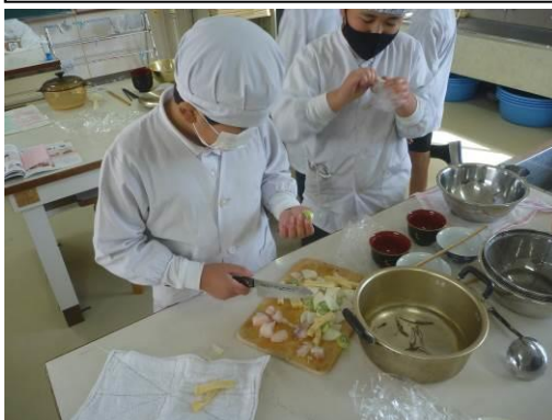
調理実習をする5年生の写真

1/17(火) 4年生がオンラインで神奈川県岩戸小学校の児童と3回目の交流学习をし、互いに新年の誓いを発表しました。