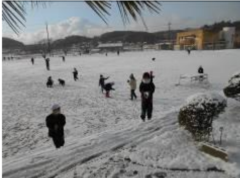
雪で遊ぶ子供たちの写真

お昼休みにも運動場周辺に残ったわずかな雪を集めて大きな雪玉を作るなど児童は消えゆく雪が名残惜しそうでした。