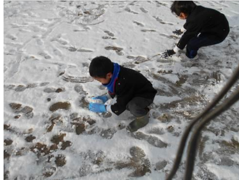
雪で遊ぶ子供たちの写真