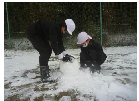
雪で遊ぶ子供たちの写真