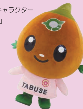
たぶせPRキャラクター 「たぶちゃん」