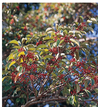
クロガネモチ (通称ミズキ)