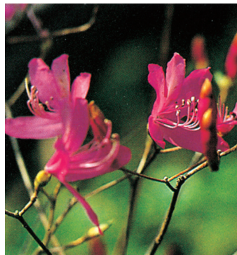
コバノミツバツツジ (通称ヤマツツジ)