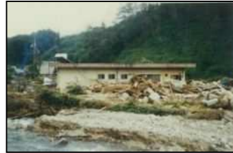
写真：昭和60年 山口県内のため池決壊事例