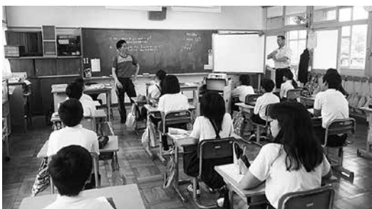
来年度から教科となる英語の授業