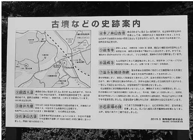
史跡の案内板(川西地区)

A 新しい観光PRの具体的方策は考えていない。観光協会の新会長は役員改選時期であり理事会の中で決定されたもの。任期は2年。古墳については駐車場看板の設置を予定している。