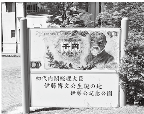
伊藤博文生誕の地にある看板(光市)