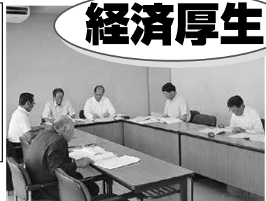
経済厚生委員会(6月12日)

経済厚生委員会を6月12日に開き、専決処分1件、補正予算1件、条例1件を予備審査、条例4件を審査しました。