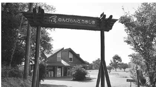
のんびらんどうましま

A 職員の意欲に対応して、個人の能力を最大限に伸ばすことにより、町の組織力を強化する。各種研修や講座への参加、町独自の研修を実施し人材育成に努めている。住民に不快な印象を与えないように、休憩室の確保に向けてフロアアップランを検討する。