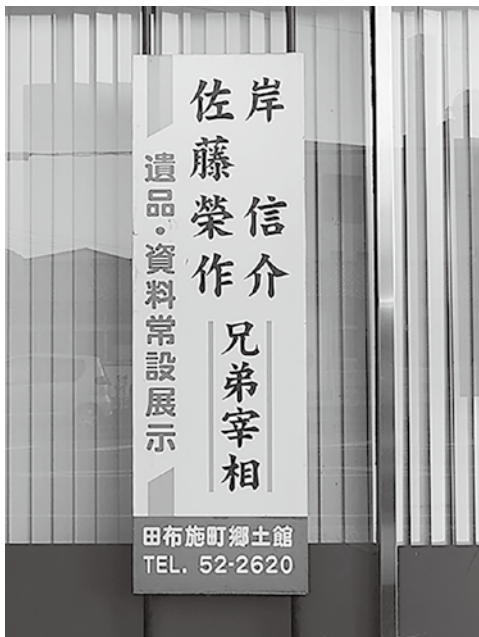
郷土館にある看板

A 町長室で、子育て世代の方とお話しした際、飾ってある兄弟宰相の写真も誰かご存じかとお聞きしても、知っておられない方も多く、私としても、大変寂しく感じている。小学3年の本町郷土読本での学習や、郷土館でのPRも努めているが、看板設置は今後検討する。