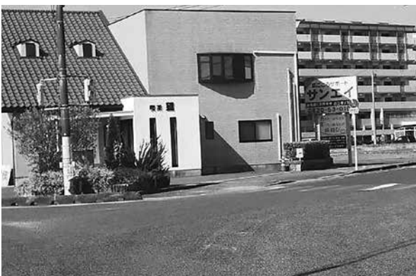
危険な波野交差点

A 大津市での園児死傷事故が発生した交差点と同じような形状の交差点は、町内の通学路において概ね20〜30箇所程度ある。車の突入を防ぐことは困難だが、一定程度効果はあるため、優先順位を決めて町として、今後、国、県及び警察に設置に向けた要請を行う。