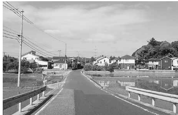
団地開発と農地が混在する地区(八和田)

10年先を展望しながら優良な農地を保全し、農業振興の各種施策を実施するための計画。「農業振興地域の整備に関する法律」に基づき市町村が定める。