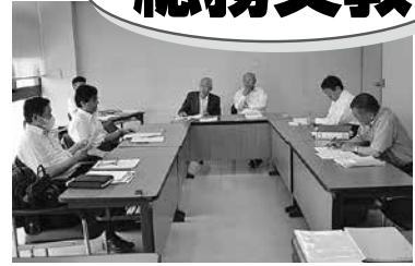
総務文教委員会(6月14日)

総務文教委員会を6月14日に開き、専決処分2件、補正予算1件、条例2件、請願1件を審査しました。