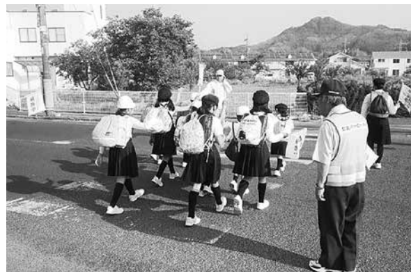
東小児童の登校の様子

Q 先日、大津市の交差点で起きた園児死傷事故が記憶に新しい。東小地区交差点で交通立哨をしたが、児童が信号待ちをしながら、いても道路からさえぎるものが無く非常に危険を感じた。町内他にも危険箇所があると思うが現場調査をして車止めポールを設置してはどうか。