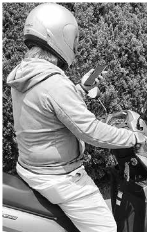
危険なスマホ操作 (写真はイメージです)

スマホ撲滅」に取り組んでいる。高齢者の免許証自主返納にも取り組み、無事故・無違反コンテストや交通安全教室を行っている。町内小中学生のスマホ使用状況はアンケートを実施し把握している。