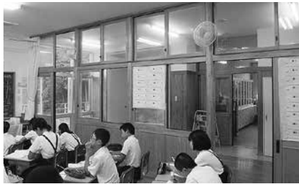
教室に設置された扇風機(麻郷小)

過大徴収した固定資産税等の返還を求める請願 請願者の方も国の意見を聞きたいと言われている。総務省の意見を聞く機会を設けるなど勉強していくということで引き続き継続審査となった。