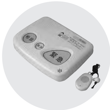
緊急通報システム

Q 核家族化や高齢化が進み、高齢者が単身で暮らす割合が増えている。本町の独居世帯は何件か。今後どのように推移していくと予想されるか。全国で孤独死の問題が大きな社会問題となっている。本町の独居世帯への見守りや対策は。