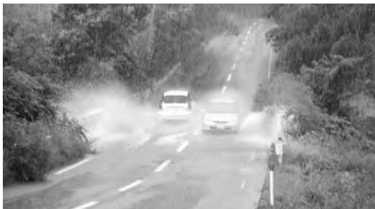
広域農道の水たまり(麻郷地区)

A 横断歩道新設、歩車分離交差点の改修などは、柳井警察署に要望書を提出し、決定がされ次第道路管理者と協議に入る。周南広域農道は、開通から20年以上経過しており老朽化が進んでいる。緊急性の高い箇所から計画的に工事を行い適正な管理に努める。