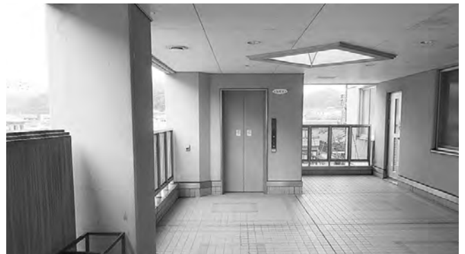
中学校のエレベーター

A 障がいを理由とする差別の禁止に関して、職員が適切に対応する事項を定めた対応要領を制定している。不当な差別的取扱いの禁止、合理的配慮の提供、相談体制の整備などを定めている。障がいのある人もない人も共に生きる社会の実現に向け、啓発活動を続ける。