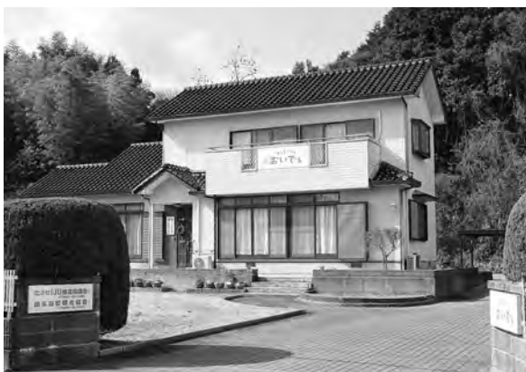
移住者を応援する施設 たぶせIJU推進協議会「おいでし」

Q 過去10年間の町内で廃業した商店等の数は。荒廃した商店街に対する支援策は。周防大島町では突出した移住や企業支援への取り組みが行われている。町の若者の移住や起業に対する支援措置は。