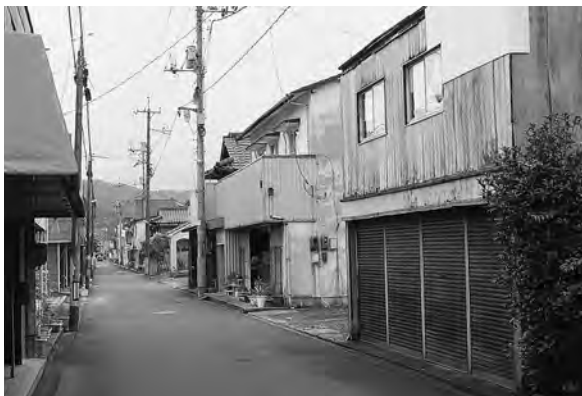
シャッターが下りる商店街

A 平成29年5月の調査によれば65歳以上の在宅単身者は717人。今後毎年10名程度ずつ増加すると見込んでいる。見守りと緊急通報装置事業を推進して支援体制づくりを行い、さらなる充実に努めていく。