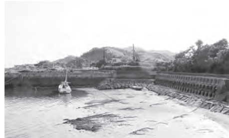
整備が待たれる尾津漁港

A ①平成 29 年度末の工事進捗率は 43%。 ②工事実施にあたり概算要求を国、県に対し要求してきたが、平成 26 年度頃から要求額の 4 割程度は配分しなくなり、施行箇所が限定され苦慮している。国、県に対しては満額配分を強くお願いしている。