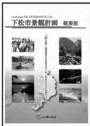
下松市 景観計画 概要版

Q 景観法の策定を計画しているがどのようなものか。景観まちづくりは作るのか。馬島は瀬戸内海国立公園であり、良好な景観形成として無線基地等工作物の建設を制限してはどうか。景観計画の策定にあたり町民、議員との勉強会、意見交換会をしてはどうか。