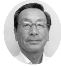
清 神 清

物心ついたころ、父親は自宅に牛、鶏、羊、山羊など飼育して、自然の中で、自給自足の生活でした。私も父親のDNAを引き継いだのか動物大好き人間になり、今では孫にまで遺伝しています。 15年前に初めて赤いメダカに出会い、今はメダカにはまっています。 赤、白、青、黒、茶、ヒカリ、ダルマメダカと次々に種類も増え、現在40種類を超えました。 毎朝地域交流館へ出荷するのが日課になり、今は静かなブームから空前のブームになっています。 何時までも趣味と共に元気で楽しい毎日でありたいと願うものです。