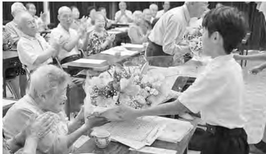
敬老会 (西田布施公民館会場)

A 前年の敬老会の参加率は 19・8% で減少傾向である。各地区に送迎バス等を運行することは難しく、提言のあった地域コミュニティの活用やアンケートの実施等により、見直しの参考にしたい。気軽に参加でき、魅力のある敬老会にしたい。