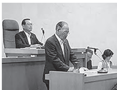
引退表明した長信町長

最終日、本会議終了直後、長信町長が健康上の理由により、次期町長選(10月16日告示、21日投票)に立候補せず、3期目の今季限りで引退する意向を表明しました。