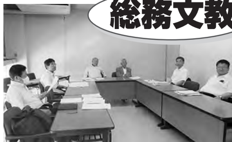
総務文教委員会(6月15日)