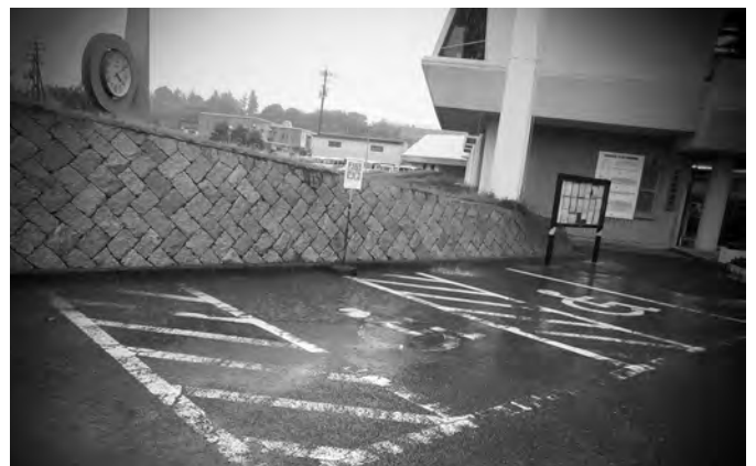
役場前の障がい者駐車場