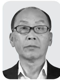
瀬石 公夫 議員

Q 少子高齢化が進み、全国的にも敬老会事業のあり方が見直されている。一人暮らしや高齢化により会場までの交通手段の無い方や、内容のマンネリ化などで、出席率が低下している。該当者のニーズの把握や地域性を活かした創意工夫が必要では。