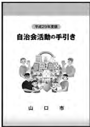
山口市 自治会活動の手引き

A 「行政協力委員の手引き」や、毎年、実施している「自治会との意見交換会」で、自治会が抱える課題や自治会活動の役割等を再認識してもらう。また、田布施町自治会連絡協議会でもご検討いただく。山口市の「自治会活動の手引き」のような資料も検討する。