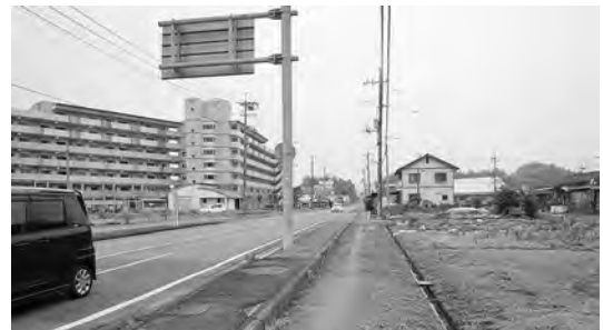
案内標識板支柱のある歩道(波野団地北)