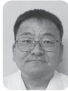
河内 賀寿 議員

Q 今年度の庁舎耐震補強工事に伴い、エレベーターが新たに設置される。これにより、車椅子の方も積極的に職員採用試験を受ける条件が整うことになる。通路の狭さなど問題点もあると思うが、次回採用試験では車椅子の方の採用も考えては。