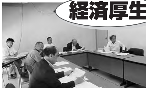
経済厚生委員会(6月13日)

経済厚生委員会を6月13日に開き、専決処分1件、 条例2件を予備審査、条例2件を審査しました。