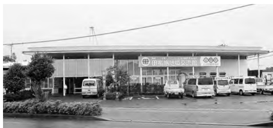
田布施町地域交流館

専決処分 田布施町税条例等の一部を改正する条例 ・法人町民税について Q 外国子会社はあるか。 A 外国子会社とは日本に親会社があるということ。田布施町にはないと思われる。 ・町たばこ税について Q 庁舎内の禁煙について。加熱式たばこの扱いは。 A 今までと変わらず庁舎内禁煙。 Q 通常のたばこより加熱式たばこが安いということ、税が高くなるのか。 A 加熱式たばこが安いということ、紙巻きたばこ