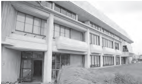
裏玄関付近にエレベーターが設置される

A 現庁舎では、事務量の増加等による窓口の狭隘化の改善は困難。よって、車椅子の方等を職員採用する場合、職場が限定されるのも現状。現在障がい者の方を対象にした採用試験の実施の予定はない。今後十分検討し、障害者雇用促進法等の主旨に沿った対応をしたい。