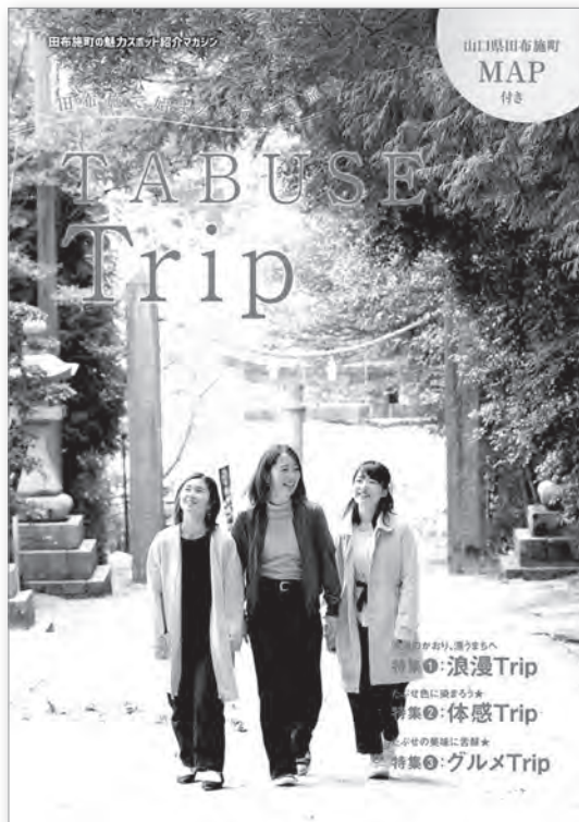
町外に発注した新観光パンフ

A 観光協会は社団法人化し、町の中心部に移転を検討。新観光パンフは観光協会と連携して作成したもので、田布施らしさを十分PRできている。史跡や遺跡には文化財専門員や郷土館長が精通している。それらの情報データは、町教委や郷土館等で管理し、閲覧可能。