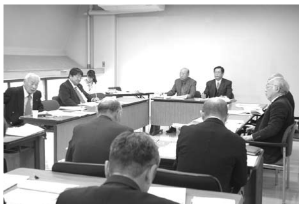
総務文教委員会(12月18日)

総務文教委員会を12月18日に開き、専決処分1件、平成24年度一般会計補正予算1件、条例改正1件、陳情1件を審査しました。