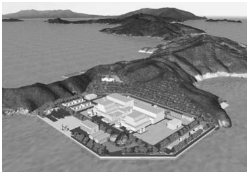
上関原子力発電所 完成予想図