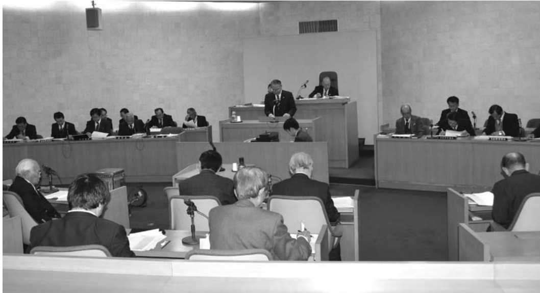
本 会 議 ( 12 月 13 日 )

平成24年12月定例会は12月13日から9日間の日程で開かれました。本定例会では、専決処分1件、補正予算4件、条例7件、人事2件の計14件の町長提出議案及び陳情1件を審議し、全議案を全員賛成で可決しました。なお、初日の本会議では、4人の議員が一般質問（P6掲載）に立ちました。