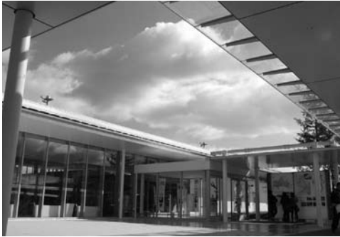
経済効果が期待される岩国錦帯橋空港