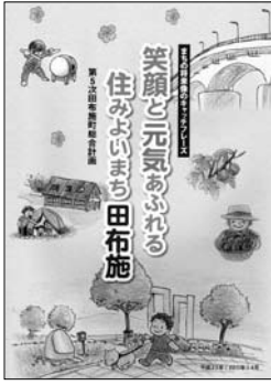
第 5 次 田 布 施 町 総 合 計 画