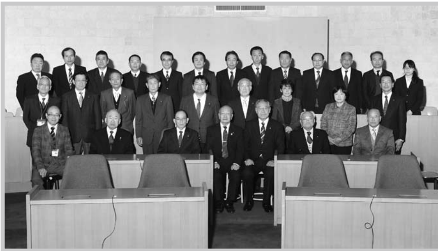
12月定例会での集合写真(12月21日)

逃げた。食いしん坊の妻が太らせて食べようか、それともペットにしようかと首に紐をかけ、散歩に連れて歩く。近所でも数人の人がウリ坊を捕まえたと聞く。罨にタヌキ、アライグマ、ウサギもかかる。やがてこの動物村にも鹿や熊が現れる日も近いのではないかと危惧する。