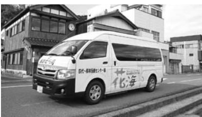
町内 2 路 線 あ る 町 営 バ ス