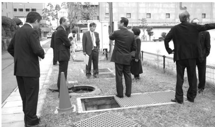
雨水貯留施設の現場視察(10月18日)

本町の町内の一部区域においても、多量の降雨による浸水被害が発生しており、大変参考になるので、研修の成果を今後の行政に生かしていきたい。