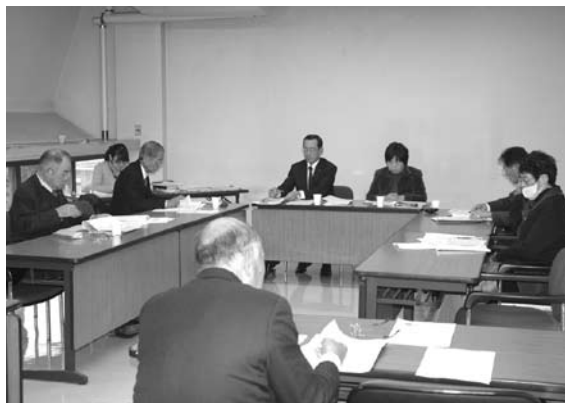
経済厚生委員会 (12月17日)

経済厚生委員会を12月17日に開き、平成24年度一般会計補正予算を調査。24年度特別会計補正予算3件、条例関係6件を審査しました。