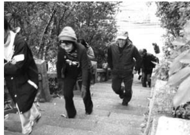
高台に避難する人たち

【Q】防 災 会 と 町 が 連 携 し た 避 難 訓 練 が 12 月 2 日 に 実 施 さ れ た が、住 民 の 関 心 も 高 く、各 団 体 な ど の 協 力 も あ り、多 くの 住 民 が 参 加 し て、地 域 住 民 の 防 災 意 識 を 高 め、大 変 有 意 義 な 訓 練 で あ っ た。訓 練 の 成 果 や 改 善 点 を 今 後 の 防 災 対 策 に ど う 生 か し て い く の か。