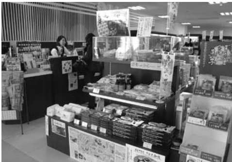
特産品も販売されている空港内売店

Q 12月13日、岩国錦帯橋空港が開港した。岩国7時半発、東京9時着の利便性は、観光、その他に経済効果大と思う。本町は空港と具体的にどう関