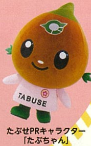
たぶせPRキャラクター「たぶちゃん」