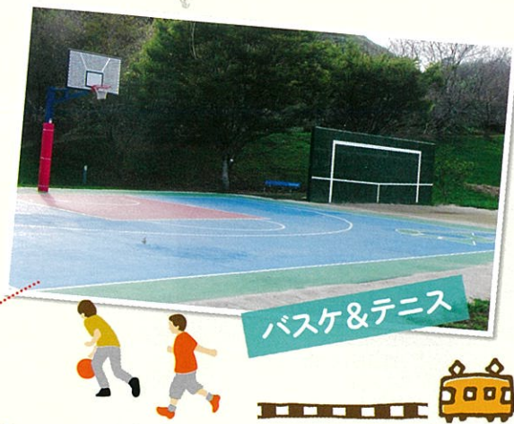
バスケット&テニス