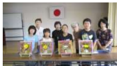
7/26(水)「生花教室(壁かけづくり)」 4名の先生方とできあがった作品を前にした4名の参加者(上)