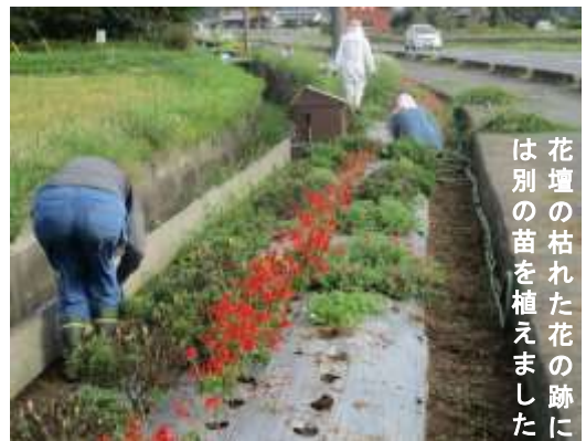
花壇の枯れた花の跡に は別の苗を植えました

暑い日々の続いた中でも少し穏やかな9月3日(日)、約一か月ぶりにコスモス広場とモデル花壇の除草作業を行いました。ボランティアを含め36名の方が参加されました。広場の草は膝丈をこえるほど伸びたものが多く、コスモスが目立たないほどたくさんありました。刈って集めるのにとても苦労しました。花壇は、マルチを敷いたおかげで例年より雑草は少なかったものの、暑さで枯れてしまった花もありました。作業は一部残りましたが二時間ほどで終わりました。参加された皆さん、お疲れ様でした。