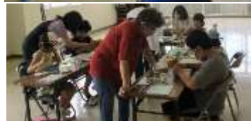
先生方の指導を受けながら、一生懸命、楽しんで制作ができました