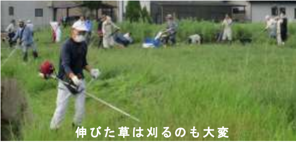
伸びた草は刈るのも大変