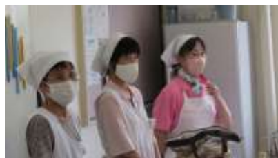
7/22(土)「子ども料理教室」 指導いただいた3名の先生方(ヘルスメイト)と参加した6名の参加者

小学校の夏休みが始まってすぐ、3つの講座を開きました。参加を希望した人は少数でしたが、どの講座にも意欲にあふれた児童が応募してくれたおかげで、充実したいい学習ができました。