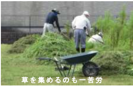
草を集めるのも一苦労