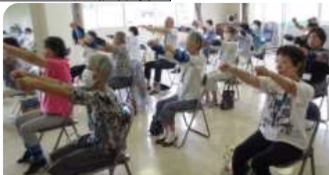
みんなで、心地よい汗を流しました