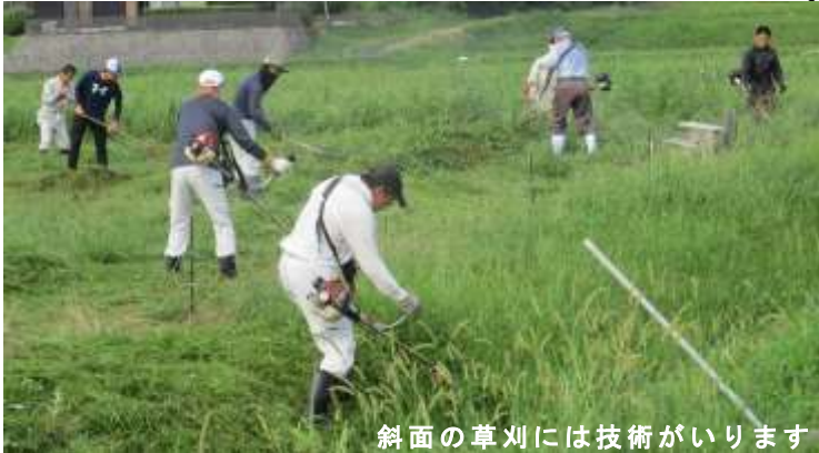
斜面の草刈には技術がいります