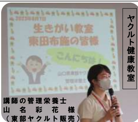
ヤクルト健康教室

8月7日(月)、講座生23名が参加して生きがい教室を開催しました。今回は、まず全員でやる「いきいき百歳体操」で体を使いました。次にヤクルト健康教室で「腸の働きの大切さ」を学びました。最後に、館長の「脳トレ」に挑戦して頭を柔軟にしました。暑い中でしたが、冷房の効いた部屋で、快適な時間を過ごすことができました。