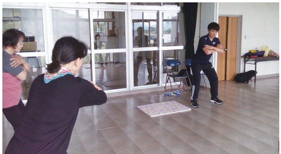
▶ ダイエットを活かしたトレーニング指導

様々なチャレンジを通して、「チャレンジすれば案外なんでもできるんじゃないか？」と感じ始めています。自分ができなかった事ができるようにするのはとても嬉しい事です。今後、どんどんチャレンジをしていき、その中で田布施町に貢献できたらなと思っています。