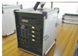
イベント音響機器

宝くじ助成事業は、財団法人自治総合センターがコミュニティの健全な発展と宝くじの普及広報を図るために、宝くじの収益により助成を行うものです。