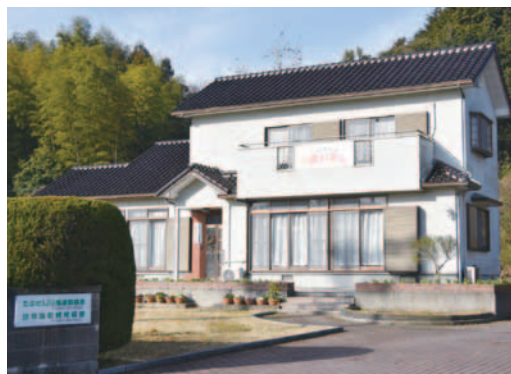
▲ 田舎暮らしの家「おいでえ」

当施設内には、たぶせIJU推進協議会と田布施町観光協会も設置されています。観光協会の電話番号は移転前と同様です。