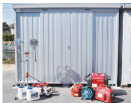
防災倉庫および備品