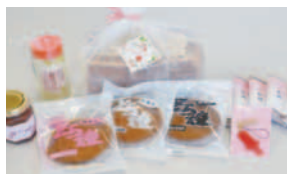
春限定セット 【3万円以上】